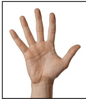
Det gamle Testamente